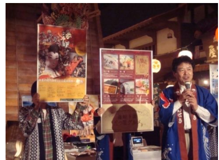
▲4/12 福岡県北九州市のみなさまによる観光PRの様様