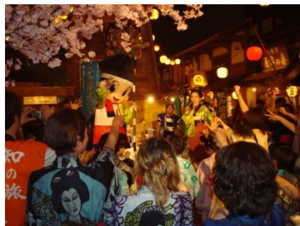
▲4/25 栃木県大田原市「与一くん」とじゃんけん大会でにぎわう会場

東京お台場・大江戸温泉物語では4月11日(土)から30日(祝)までの土・日・祝の7日間、日本各地の7県とタイアップし、「ゆるキャラ大集合」を開催。ご当地「ゆるキャラ」とともに地方の薫りを味わえる仕掛け(名産品試食、ゆるキャラ記念撮影会、プレゼント抽選会、名産品物販)を行い、お子様からシニア夫婦までお楽しみいただきました。